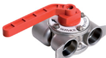
By-pass en acier inoxydable