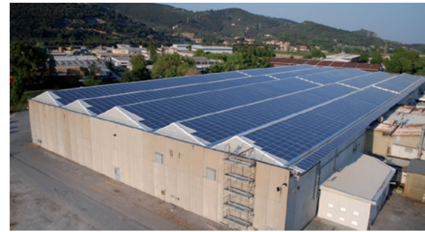
Site de production Fleck de Pise en Italie

Fleck Controls, Inc. a été fondée aux États-Unis en 1950. Cette société a commencé à produire des vannes à saumure en 1958 et la première vanne pour l'adoucissement d'eau en 1963. Pentair, leader mondial des produits de contrôle de débit haute technologie offrant des solutions innovantes pour les applications résidentielles, commerciales et industrielles a acquis Fleck en 1995.