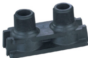
Adaptateur fileté en plastique