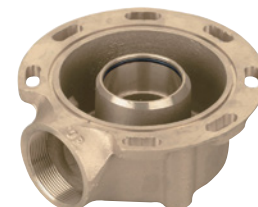
Adaptateur de montage latéral rotatif pour modèles 2850 ou 2910